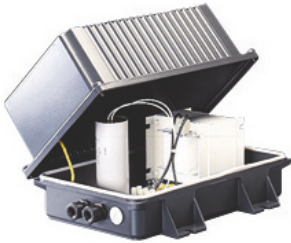
Grupo de alimentación.