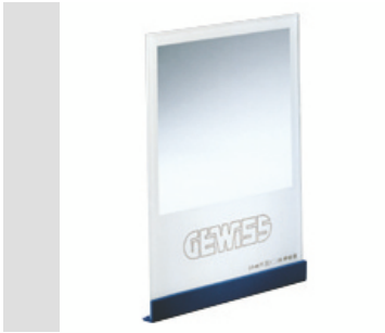
Blendschutzraster für HORUS 3.