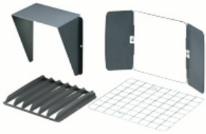
Streuglas, ESG, für HORUS 2.