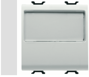
Red Dot anotlanmış alüminyum işaretçi desteği siyah