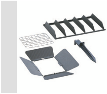
Vârf de plastic.