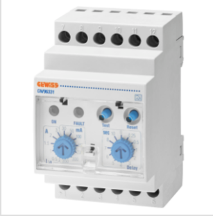
תיאור ממסר זרם דלף עם טורואיד נפרד 100A מודולים 3 מידות