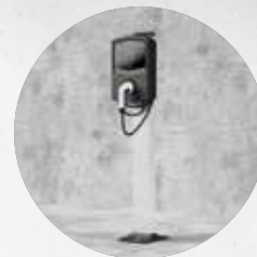
MONTAŻ NA PODŁOŻE Z UCHWYTEM