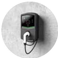
MONTAŻ NA ŚCIENNY

Ładowarka I-CON jest nie tylko intuicyjna, bezpieczna i wygodna w użyciu, ale także łatwa w instalacji i obsłudze. Nadaje się do stosowania w pomieszczeniach i na zewnątrz oraz umożliwia różne scenariusze instalacji.