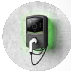
WERSJA Z PODŚWIETLENIEM