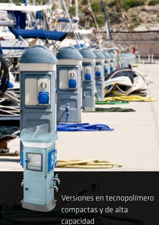
Versiones en tecnopolímero compactas y de alta capacidad