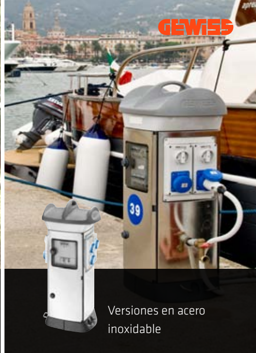
Versiones en acero inoxidable