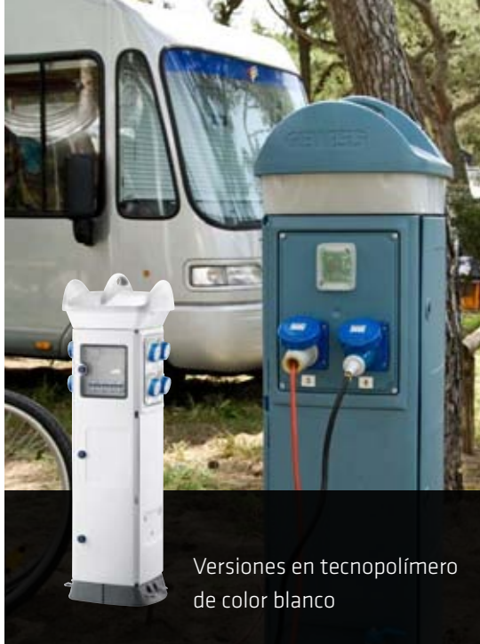
Versiones en tecnopolímero de color blanco